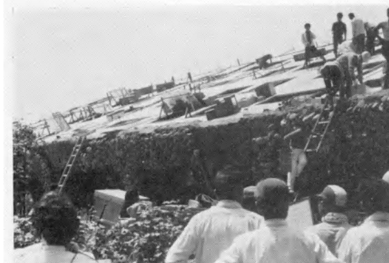
液状化現象によって県営アパートが転倒（新潟市内）