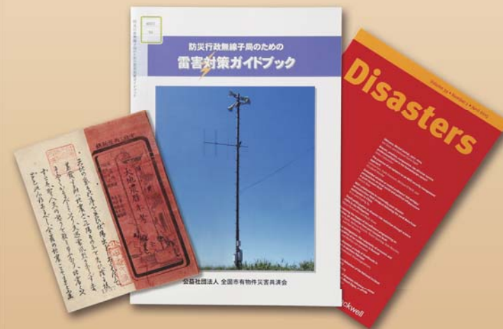
当館所蔵「大地震暦年考」安政3(1856)年、他